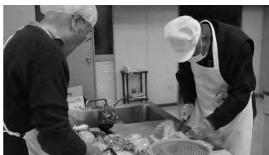
「普段、料理はせんよ!」「普段から、やらされとるよ!」 など、男性の声は様々

天満地区社会福祉協議会(天満地区社協)は、毎月1回、中広会館で「ふれあいサロン会食会」と「ますます健康お達人教室(※1)」を開催しています。サロンでは、昼食を食べながらおしゃべりしています。サロン終了後、お達人教室では、講演や体操など行っています。