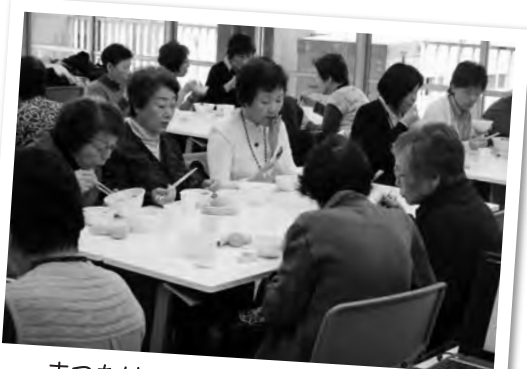
まつたけの香りに、秋の訪れを感じて