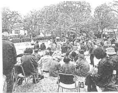
ガーデンハウス自治会

肌寒さの中、3、4部咲きの桜のもと心もむまつりでした。多くの参加者の皆さん、ありがとうございました。