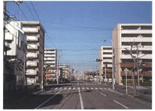
現在の吉島病院前バス通り北望