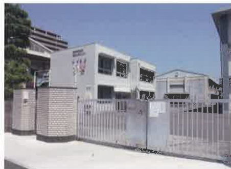
現在の広島南特別支援学校