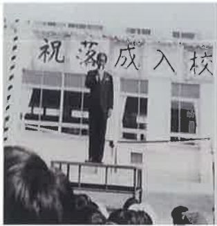
吉島東小学校落成式 昭和 52 年(1977 年)