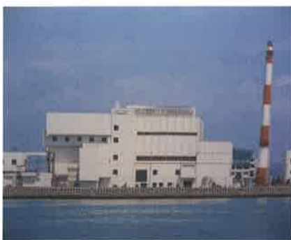
旧中工場 昭和 51 年(1976 年)建設