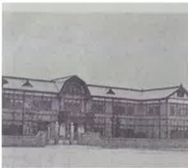
聾学校 昭和 9 年(1934 年)