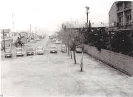
吉島通り南端から北望 昭和 42 年(1967 年)