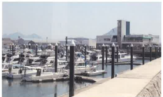
現在のボートパーク広島