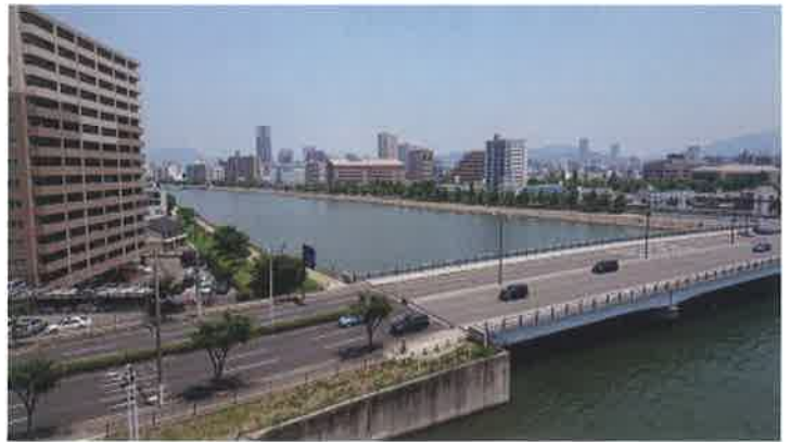
現在の南千田橋 平成 4 年(1992 年)開通