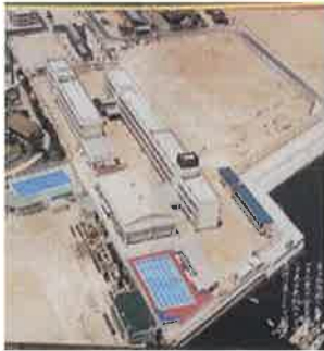
吉島中学校 (初期の卒業アルバムより)