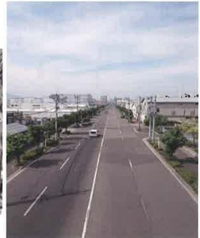
現在の吉島通り南端から北望