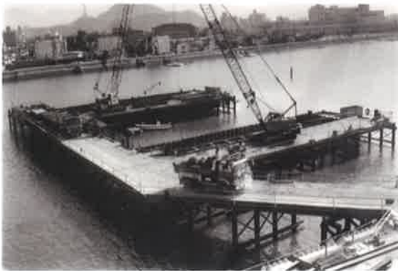
南千田橋建設中 昭和 61 年(1986 年)