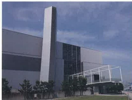
現在の中工場 平成 16 年(2004 年)