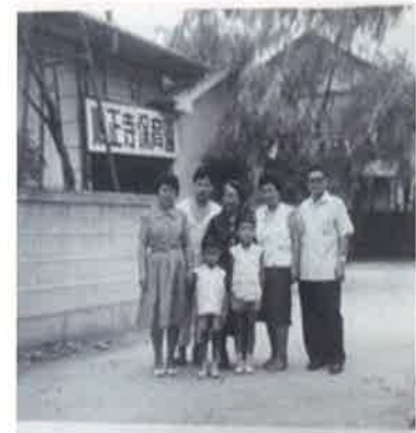
設立当初の順正寺保育園