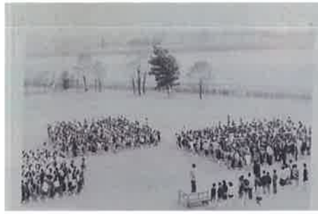
開校当初の朝礼風景