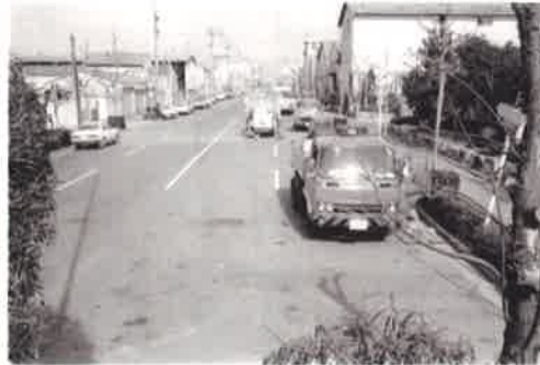
吉島通り南端から北望 昭和 62 年 (1987 年)