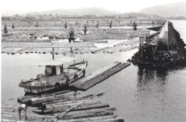
貯木場(現ボートパーク広島)昭和 41 年(1966 年)