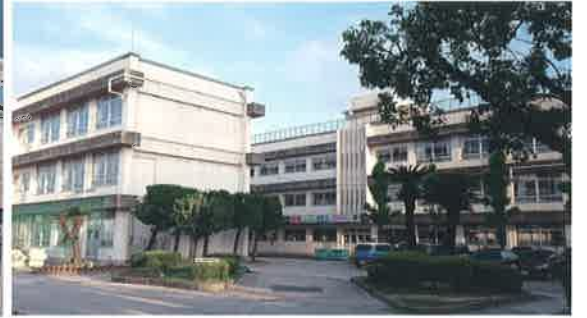
現在の吉島中学校