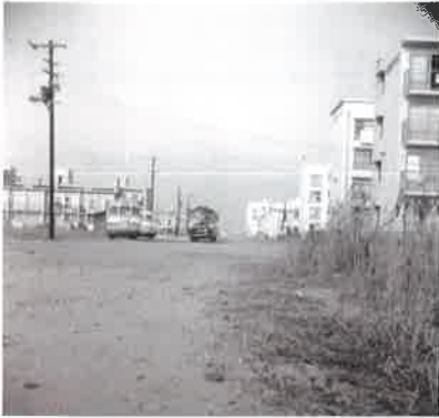
吉島病院前バス通り北望 (左が県営アパート・右が市営アパート) 昭和 31 年(1956 年)