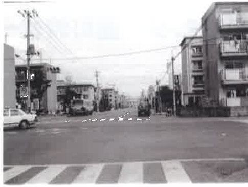
吉島病院前バス通り北望 昭和 62 年 (1987 年)