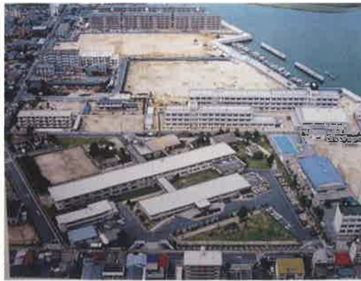
吉島中学校近隣 昭和 58 年(1983 年) (吉島病院 30 年史より)