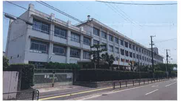
現在の吉島東小学校