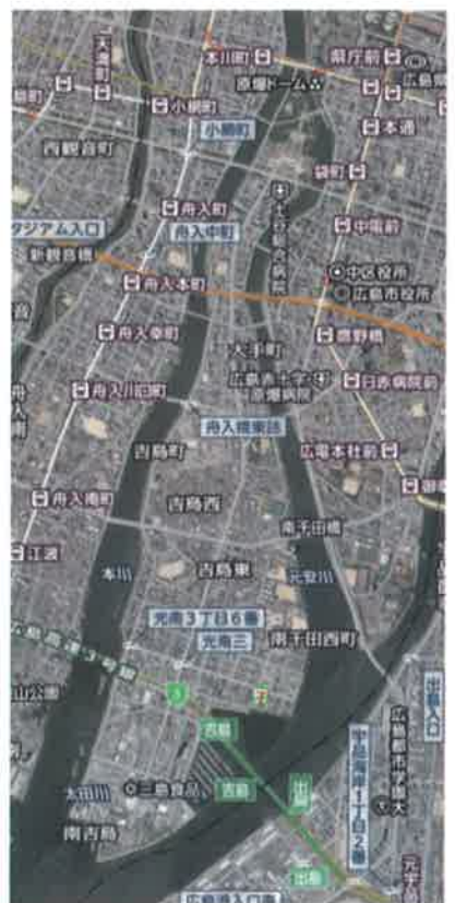
2017年 平成29年 Google