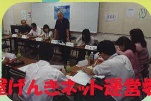
竹屋げんきネット運営委員会