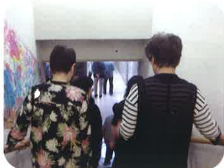
日時 6月26日(水) 11時ごろ