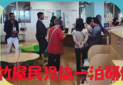
竹屋民児協一泊研修