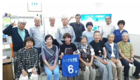
三島食品(株)広島工場