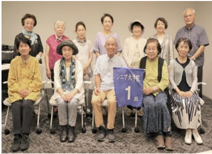
広島銀行本店 ソリューション営業部

◎ 1班 実施日：7月28日(金曜日) 場 所：広島銀行本店ソリューション営業部