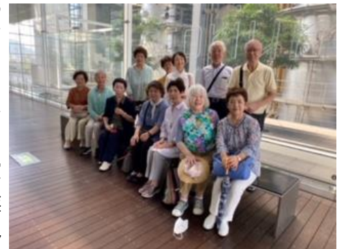
広島市環境局中工場