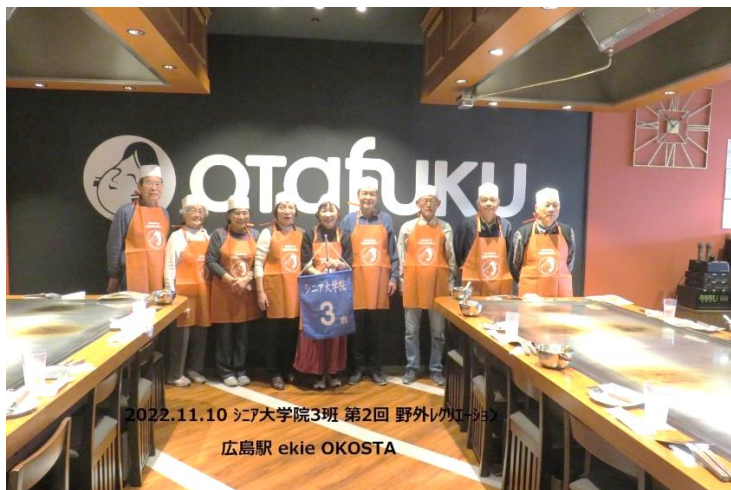
2022.11.10 シニア大学院3班 第2回 野外レクリエーション 広島駅 ekie OKOSTA

11月10日（木）に、広島駅 ekie『OKOSTA』のお好み焼体験スタジオで、お好み焼の作り方を教えてもらいながら自分たちでお好み焼を作り、その美味しいお好み焼を食べた